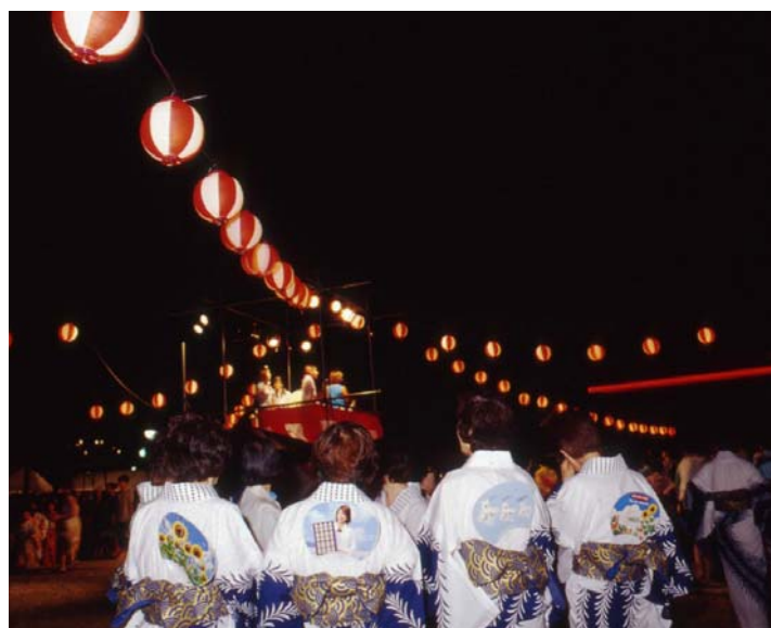
みんなそれぞれに 夏のこの時間を楽しんでいます。