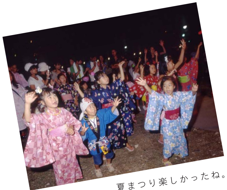
夏まつり楽しかったね。