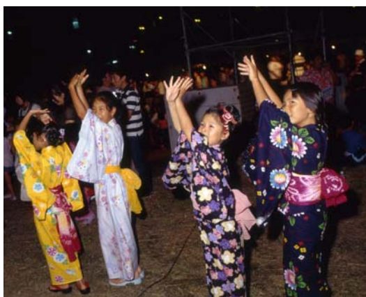
最後はみんなでキメて。