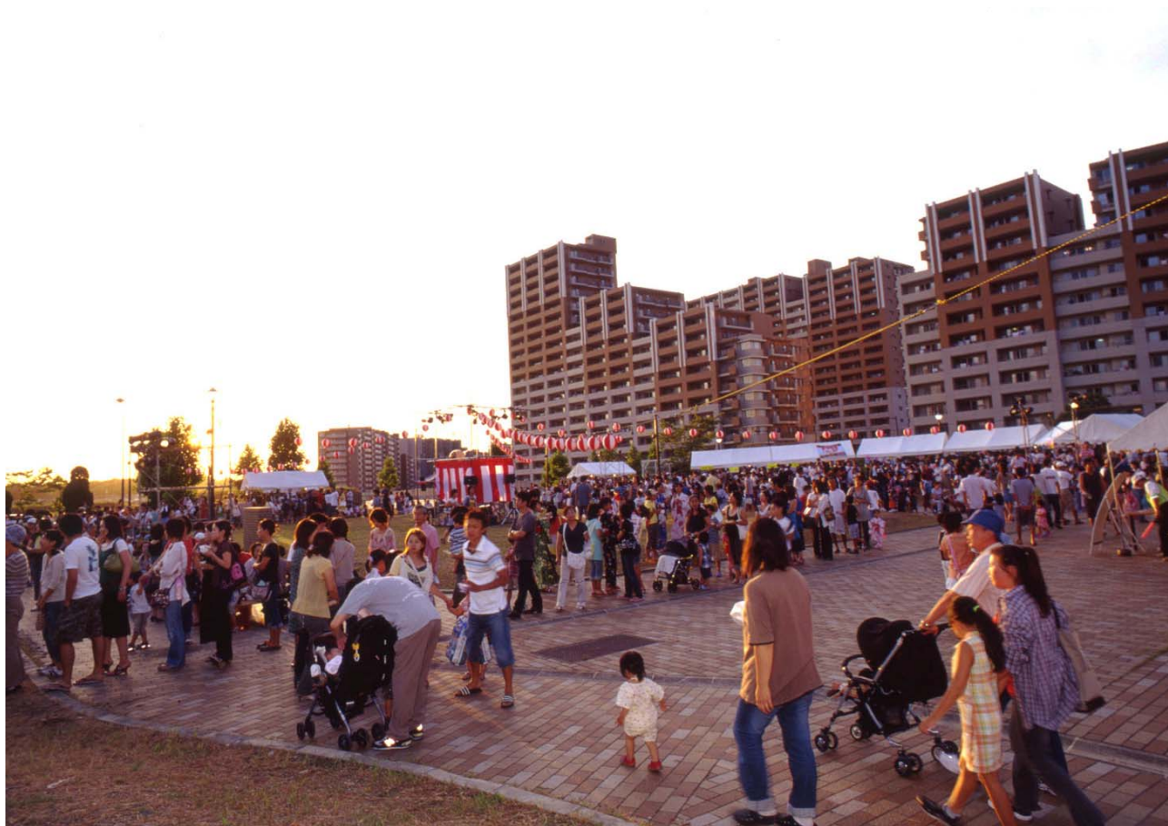
夕焼け空に、まちの人たちが集まりはじめました。