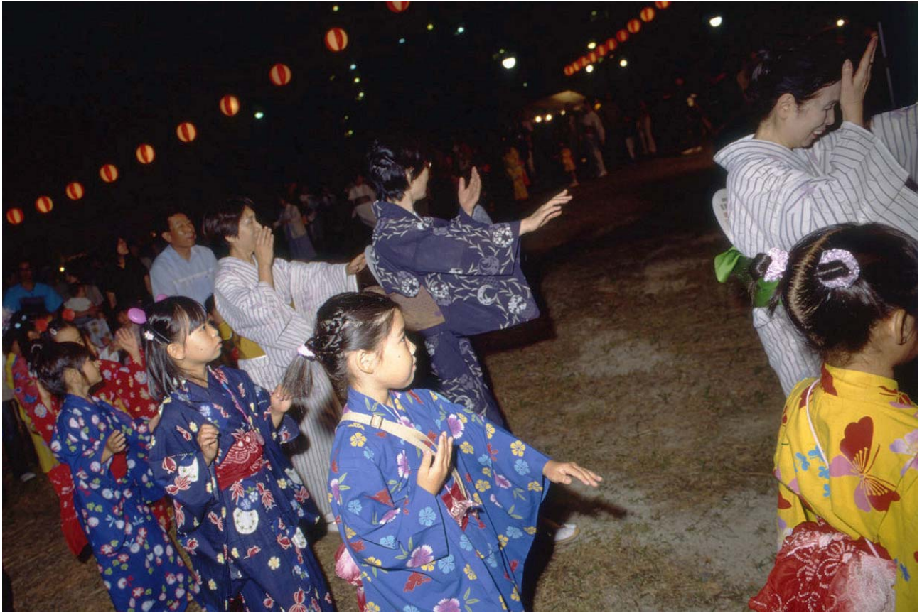
だんだん輪も大きくなってクライマックスね 子どもも大人も一緒になって盆踊りに、ダンス！ダンス！