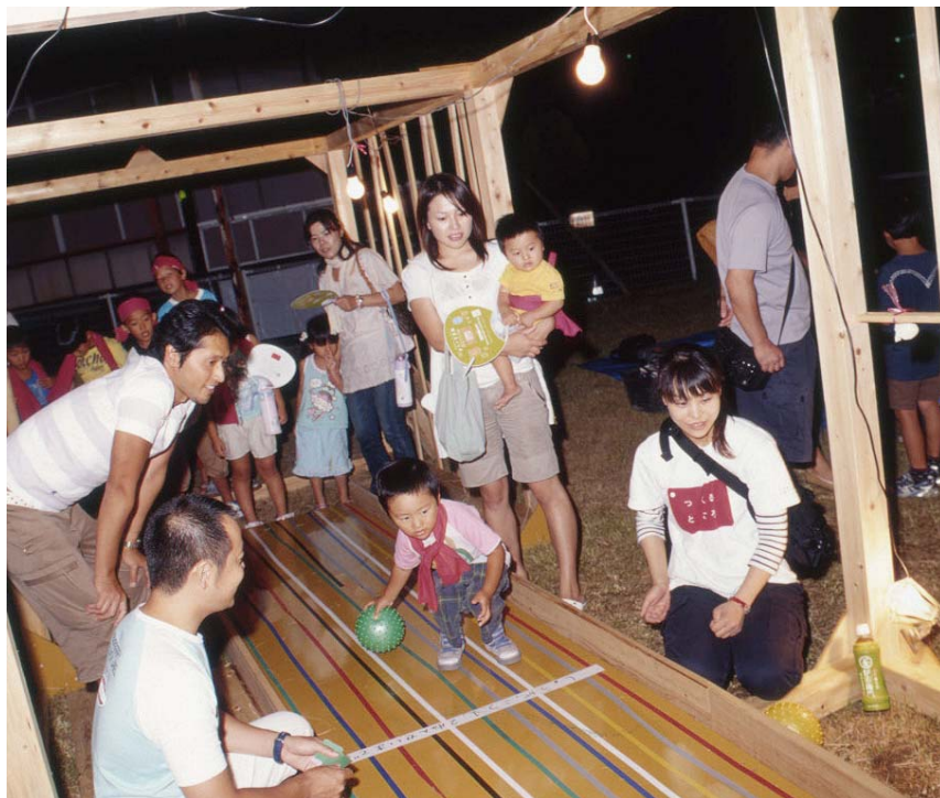
ここでは手づくりボーリング。